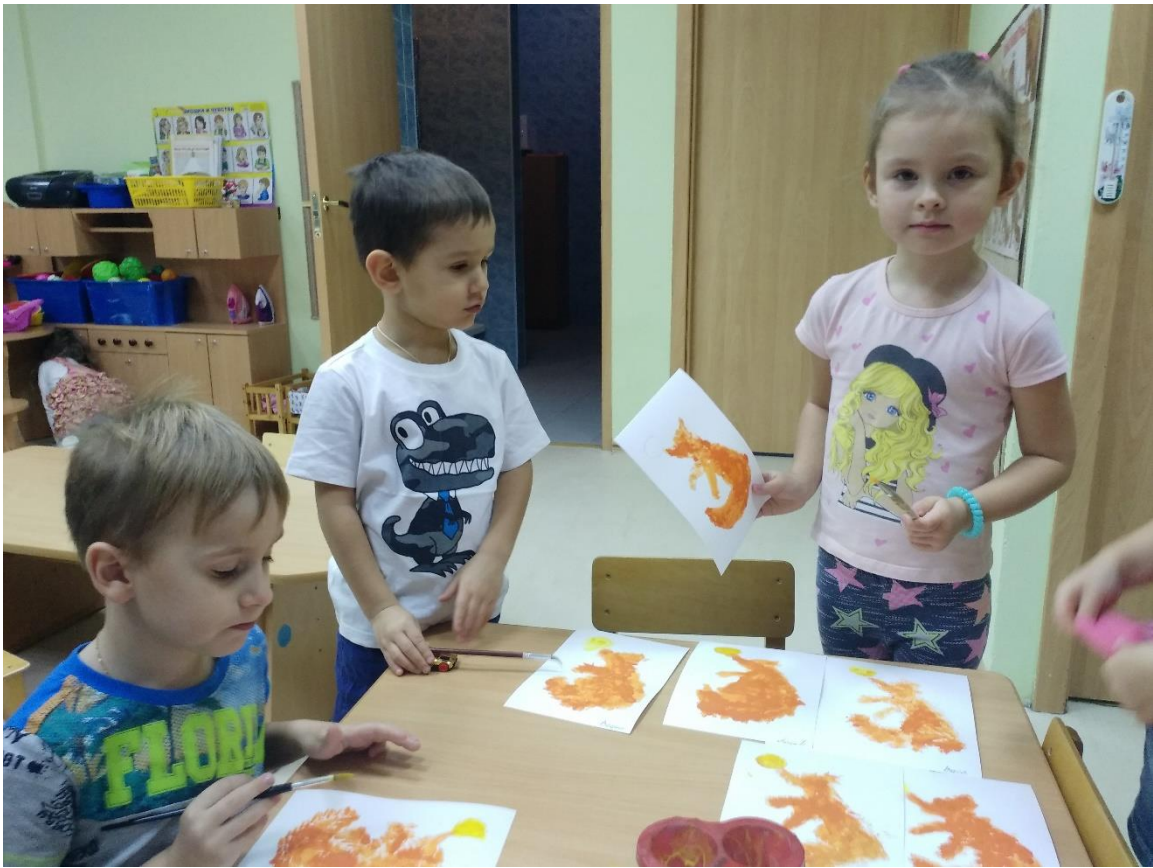
Оформили выставку наших рисунков