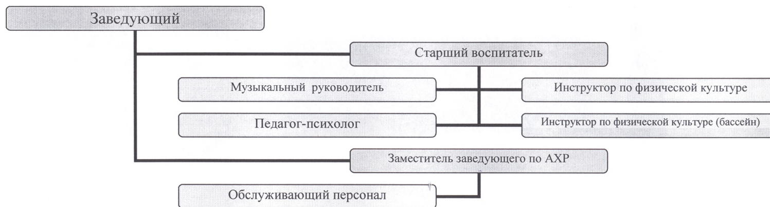
СХЕМА ВНУТРИСАДОВСКОГО УПРАВЛЕНИЯ ГБДОУ