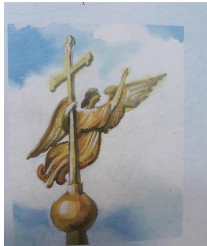
Югер в виде летящего ангела венчает шпиль Петропавловского собора. Находит